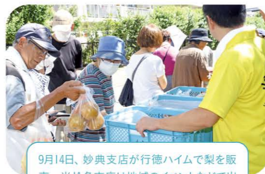
9月14日、妙典支店が行徳ハイムで梨を販売。当JA各支店は地域のイベントなどで出店し、地元の農産物を販売しています