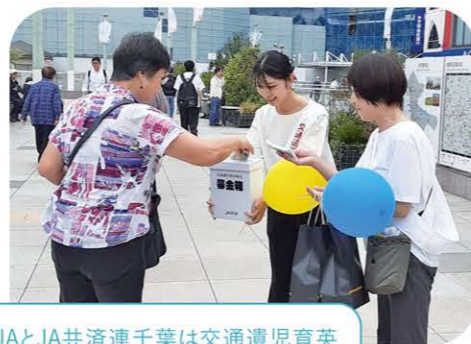
当JAとJA共済連千葉は交通遺児育英募金活動を展開。地域の皆さまが暮らしやすい社会づくりを行っています