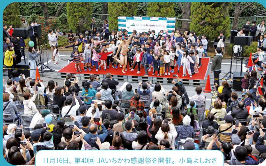
11月16日、第40回 JAいちかわ感謝祭を開催。小島よしおさんのお笑いショーなどを行い、約3500人が来場しました