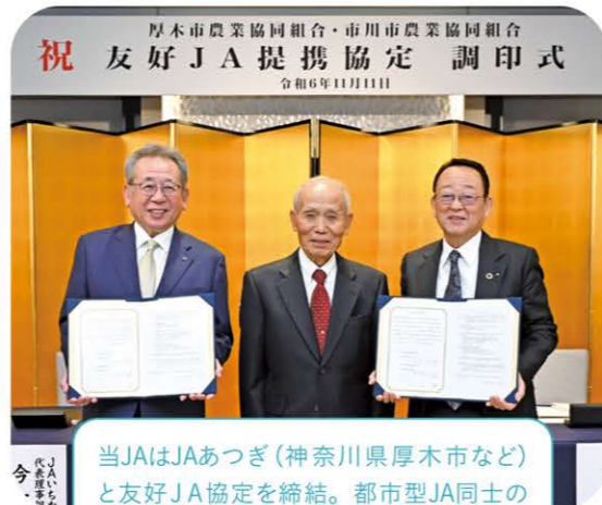
祝 厚木市農業協同組合・市川市農業協同組合 友好JA提携協定 調印式 令和6年11月11日 当JAはJAあつぎ（神奈川県厚木市など）と友好JA協定を締結。都市型JA同士の協定締結で地域農業の発展とJA組織活動活性化を目指します