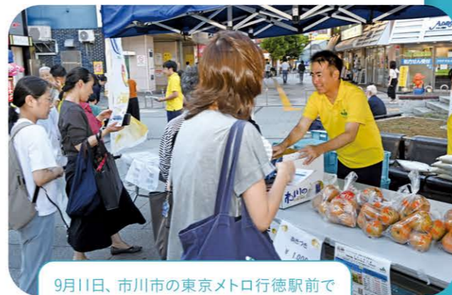
9月11日、市川市の東京メトロ行徳駅前「市川のなし」の特別販売会を開きました