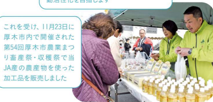
これを受け、11月23日に厚木市内で開催された第54回厚木市農業まつり畜産祭・収穫祭で当JA産の農産物を使った加工品を販売しました