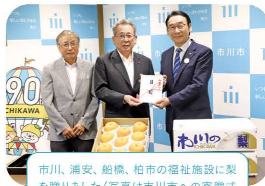
市川、浦安、船橋、柏市の福祉施設に梨を贈りました（写真は市川市への寄贈式の様子）