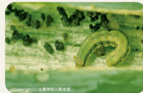
シロイチモジヨトウの幼虫