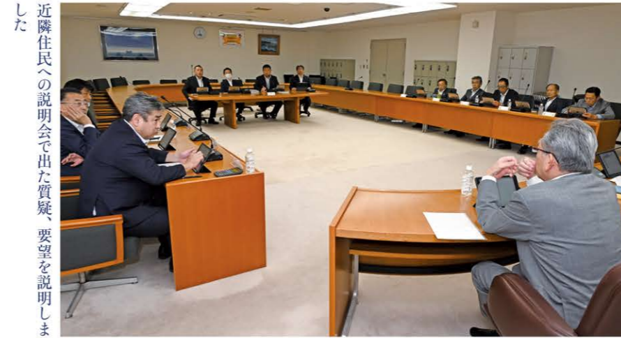
近隣住民への説明会で出た質疑、要望を説明しました