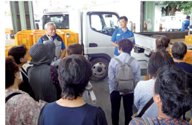
9月4日開催カルチャー教室、船橋梨選果場でその役割を学びました

また、昼食に「柏こだわり田中産こしひかり」を使った弁当を用意。帰りには梨と新米を参加者にプレゼントしました。