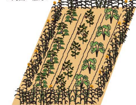
図2 障壁効果のあるソルガム 畑にナス、トマト、サトイモなどを育て、ソルガムは周囲に植える

参考資料:「カバークロープ・草生栽培 栽培指針」千葉県、千葉県農林水産技術会議(平成24年3月)、「緑肥利用マニュアル」農研機構(令和2年3月)。