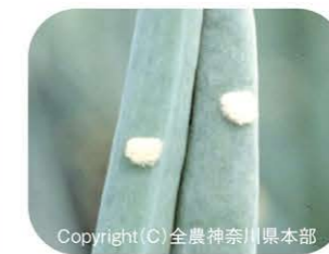
シロイチモジヨトウの卵塊