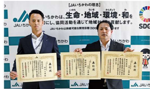
山崎課長(右)と青山係長