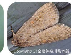
シロイチモジヨトウの成虫